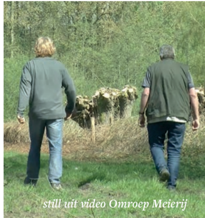
still uit video Omroep Meierij

Inmiddels heb ik vele mooie wandelingen gemaakt en weet goed de weg in en rond Schijndel. De mooiste wandelingen heb ik samen met deelnemers gemaakt in Eerde, Vlagheide werd een van de favoriete plekken.