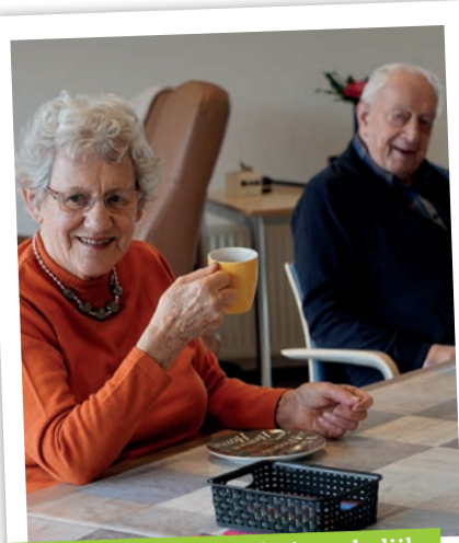
Dagbesteding aan huis: thuis wekelijks een leuk pakketje