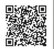
Scan de QR-code voor cursusoverzicht

met prentenboeken, een webinar meertaligheid en een workshop creatief met spel en taal. Alles was er op gericht om contact te houden én op een leuke manier te blijven leren. Gelukkig konden we ook boeken aan huis afgeven om thuis voor te lezen.