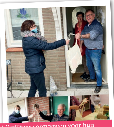
Vrijwilligers ontvangen voor hun inzet en betrokkenheid een tas met inhoud.